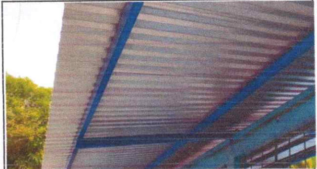
FOTO 2: Sustitución de estructura de soporte de hierro de metal, por metal(modulo aula I)