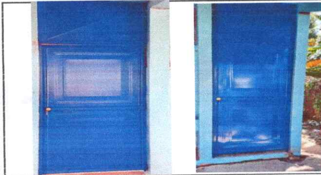
FOTO 3: Sustitución de puerta (modulo de aula I y modulo aula II)