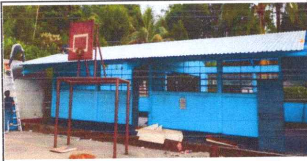
FOTO 1: Sustitución de lámina, por lámina troquelada aluzinc calibre 26 (modulo aula I)