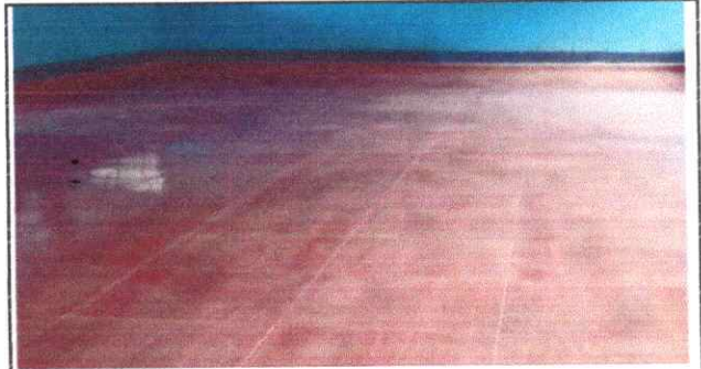
FOTO 4: Sustitución de piso de cemento liquido por piso ceramico (modulo de aula I)