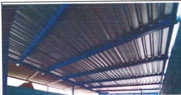
FOTO 5: Sustitución de lámina, por lámina troquelada aluzinc calibre 26 y estructura portante (MODULO AULA II)